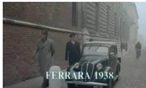
Sfiducia nei confronti del futuro